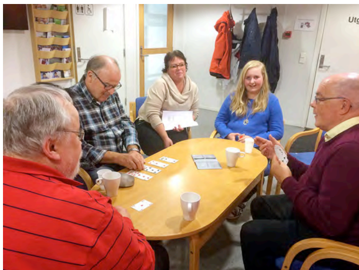
Frå eit lynkurs på tannklinikken hausten 2014.

Kursverksemda blei monaleg auka denne sesongen samanlikna med dei siste sesongane. I oktober/november arrangerte vi to lynkurs ("Lær bridge på tre timar"), og totalt hadde vi 7 deltakarar på desse. I tillegg var vi i kontakt med andre som kan vera aktuelle for framtidige kurs. I januar/februar arrangerte vi eit kurs over 8 kveldar med 5 deltakarar.