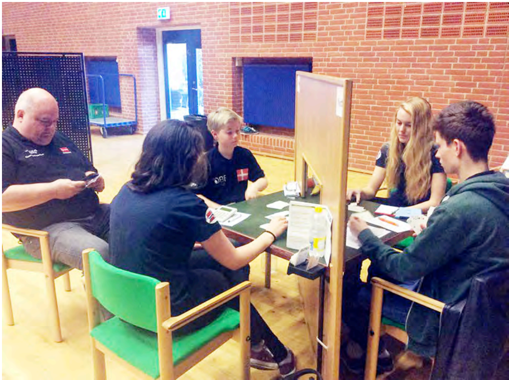
Frå kampen mot det danske U21-laget, ein kamp jentene tapte med nokre få IMP.